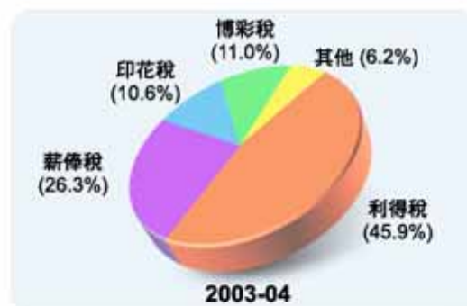
圖 2 稅收組合