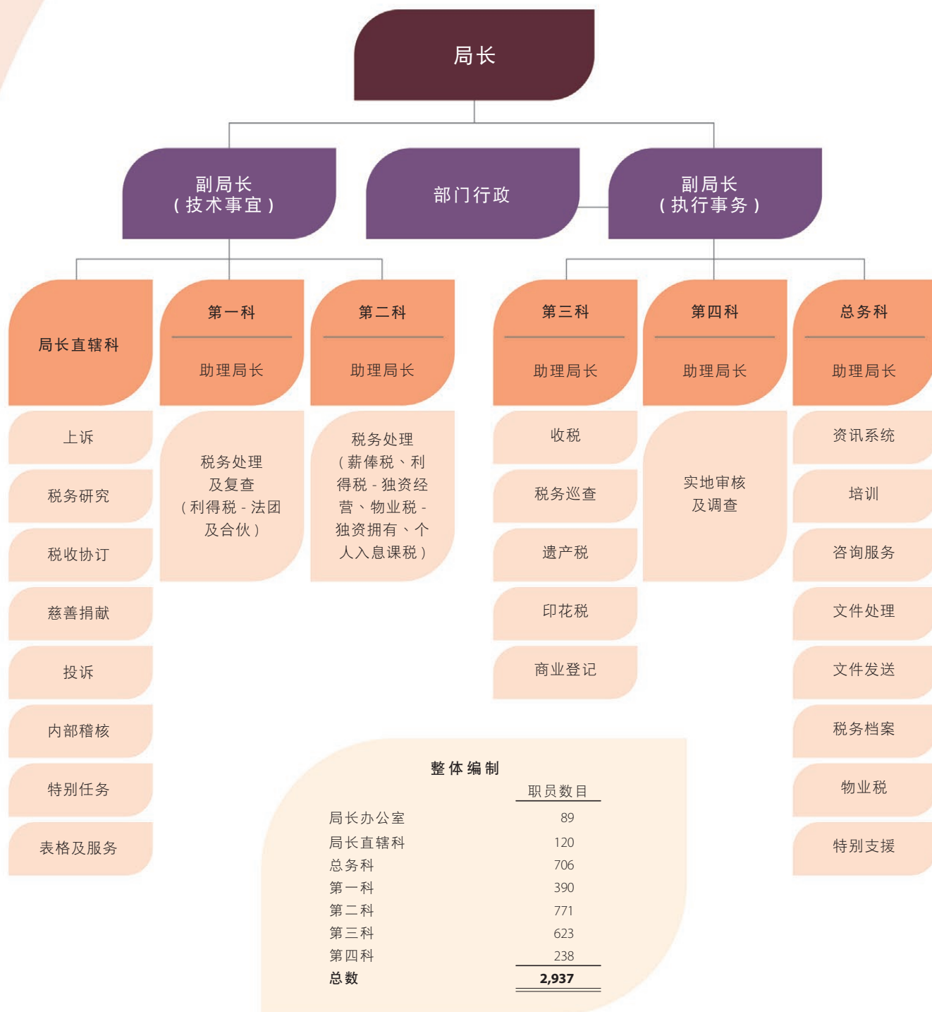
税务局组织图（在 2023 年 3 月 31 日）