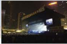
外地演藝人員或運動員來港表演而收取款項，須繳付利得稅，由香港付款人代扣繳稅款。

徵稅對象無分香港居民或非香港居民。香港居民得自海外的利潤無須在香港課稅；非香港居民如在香港營商並賺取源於香港產生的利潤，則須課稅。