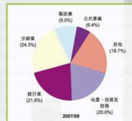
主要行業佔利得稅比重

隨著香港經濟轉型，地產和金融業繳付的利得稅，比重愈來愈大。在2007/08年度，該兩行業經評定的稅款，合共佔利得稅總額超過4成。