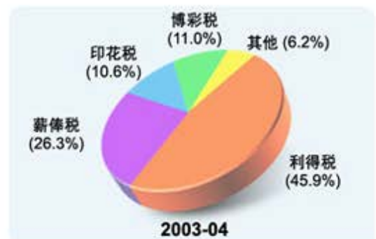
图 2 税收组合