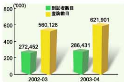
圖 37 櫃位查詢

此外，本局在諮詢中心派駐一隊專業人員，負責處理較繁雜個案，為市民提供快捷方便的服務。由於市民對九龍及荃灣分局提供的服務需求下降，為了更有效運用資源，九龍及荃灣分局已於 2003 年 8 月 1 日關閉，市民親臨稅務大樓作出櫃位查詢的數目相應增加，全年的查詢次數較上一年度上升 11%（圖 37）。