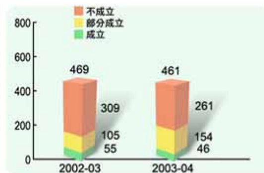
圖 38 投訴個案

本局在過去一年共收到 111 封納稅人致本局的嘉許信，2 名職員更在申訴專員嘉許獎計劃中獲得個人獎項。