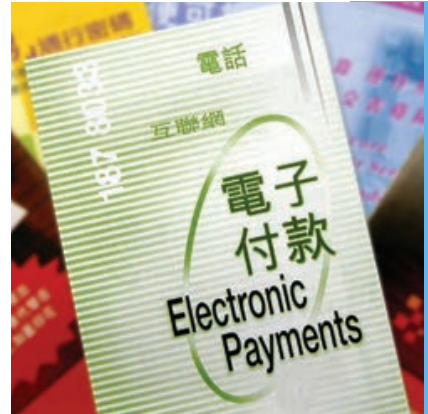
圖 28 繳稅方法

本局提供多種繳稅方法供納稅人選擇。圖 28 展示納稅人在 2005 至 06 年度所選用的繳稅方法。電子方式繳稅（包括電話、銀行自動櫃員機及互聯網）獲廣泛使用。2005 至 06 年度入息及利得稅個案當中，電子付款占總數的 57%。