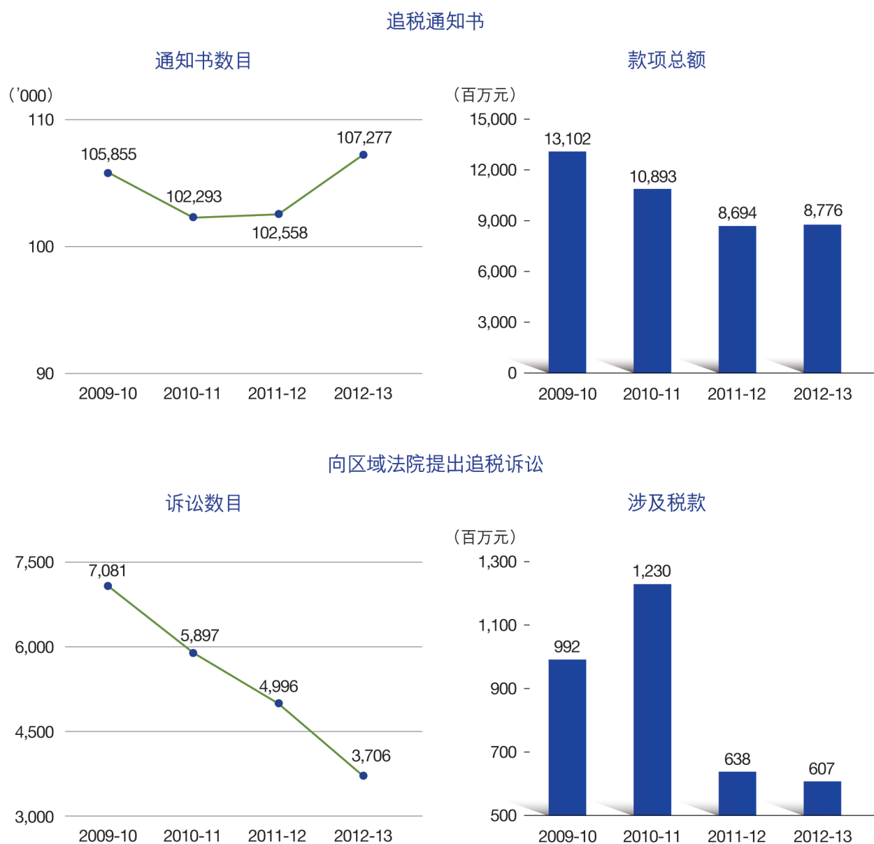
图 26 追税行动