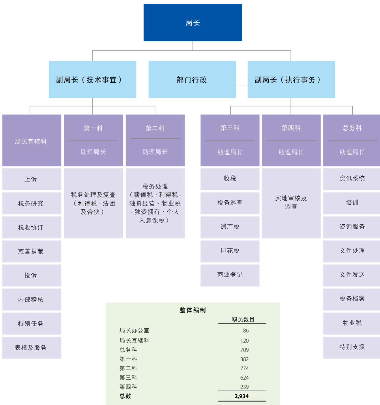
税务局组织图（在 2022 年 3 月 31 日）